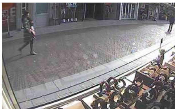
Juweliers leveren zichtveldfoto's aan van hun eigen situatie