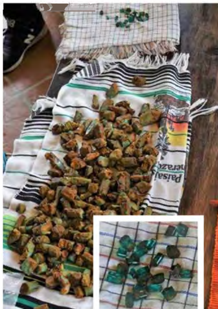
Foto 6. Voorbeeld van gangbare winning van smaragd, waarbij de meeste kristallen (op de voorgrond) niet helder genoeg zijn en een te lichte kleur hebben. Slechts een zeldzame, kleine hoeveelheid is slijpbaar en echt van goede kwaliteit (bovenaan op de achtergrond, rechts naar voren gehaald).

Het was fascinerend om alle veranderingen, modernisering en ook nog steeds enorme potentie in Muzo en Chivor van dichtbij te kunnen zien. Geologisch gezien zijn de Colombiaanse smaragdafzettingen uniek, met de erosie van granieten en ultramafische (donkere) gesteenten tijdens de vorming van het Andes gebergte, en het ontstaan van dikke pakketten klei in grote zeebekkens als resultaat, die later onderdruk omvormden in zwarte schalies, vol met essentiële bestanddelen voor de vorming van smaragd, zoals aluminium, beryllium, vanadium en chroom. Latere beweging van plastische zoutlagen onder deze schalies hebben een sleutelrol