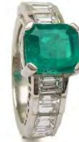
Foto 1. Colombiaanse smaragd is populair door de intense groene kleur, gecombineerd met helderheid en soms een flinke grootte. De smaragd in deze ring is ongeveer 9 x 8 mm en weegt circa 3,4 karaat.

Wereldwijd groeit nu de erkenning dat bedrijven ervoor moeten zorgen dat hun toeleveringsketens niet worden aangetast door allerlei vormen van misbruik. Traceerbaarheid staat hierbij hoog op de agenda. Waar komt