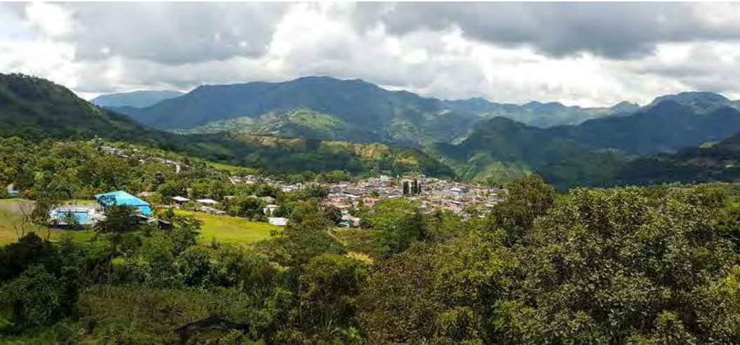
Foto 2. Het dorpje Muzo ligt in een bergketen, de Oostelijke Cordillera, ten noorden van Bogota, de hoofdstad van Colombia. De Muzo regio is rijk aan smaragdvoorkomens. De Cunas, La Pita, Cosquez en Penas Blancas mijnen liggen vlakbij.

Colombia timmert hard aan de weg om smaragd als edelsteen op de kaart te zetten. Met name in de twintigste eeuw zijn wereldwijd best een flink aantal smaragdvindplaatsen ontdekt, onder andere in Brazilië, Rusland en Zambia. Toch is door de eeuwen heen vooral in Colombia echt veel smaragd gevonden.