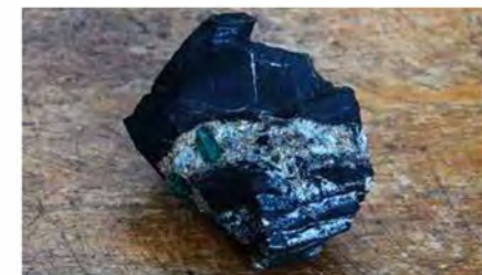
Foto 5. Voorbeeld van een handstuk (ongeveer 12 centimeter breed) met smaragd, gevonden in Chivor. Smaragd is hier gevonden precies in een plooi van zwarte schalie, waar de witte (calciet) ader in is gedrongen, met aan de randen veel pyriet (met messinggele metaalglans) en smaragd in het midden.

Colombia komt weliswaar van heel ver, maar heeft inmiddels grote stappen gemaakt om te voldoen aan de eisen van de internationale markt. Men probeert nadrukkelijk voorbeelden van model smaragdmijnen in Zambia (Kagem) en Brazilië (Belmont) te volgen en slaagt daar steeds beter in. Verantwoorde winning van smaragd vindt hiermee niet alleen plaats in Zambia en Brazilië maar ook met nadruk in Colombia.