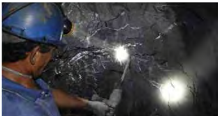
Foto 4. Witte en vaak heel dunne aders in zwarte schalies worden voorzichtig aangeboord, op zoek naar smaragd. Gecombineerd met plaatsen van dynamiet en gedoseerde explosies wordt stap voor stap doorgezocht.

verantwoord ondernemen in de smaragdindustrie kan helpen om de sociale omstandigheden te verbeteren en tegelijkertijd het vertrouwen in smaragd in Colombia (en daarbuiten) te versterken. Dit omvatte ook branding en detailhandel in het nieuwe millennium en het gebruik van sociale media naast de traditionele rode loper om 'het Colombiaanse smaragd-merk' bekendheid te geven. Duidelijk werd dat kleine bedrijven van lokale mijnwerkers meer steun nodig hebben; ze moeten ook een grotere stem en een groter aandeel krijgen in de industrie. Tevens moeten ze worden opgenomen in een legale, legitieme distributieketen. Tegelijkertijd is het de kunst om met het promoten van verantwoord ondernemen op alle niveaus, de kleine ondernemingen niet ernstig te benadelen. Men kijkt dan vooral naar de investeringen en potentieel hoge kosten die ermee gemoed zijn.