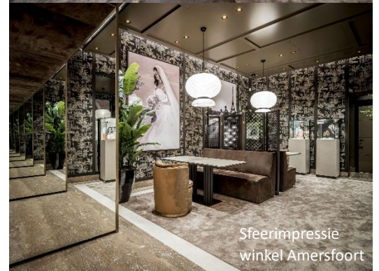
Sfeerimpressie winkel Amersfoort

Herken jij je in bovenstaande omschrijving en wil je onderdeel uitmaken van ons mooie team?